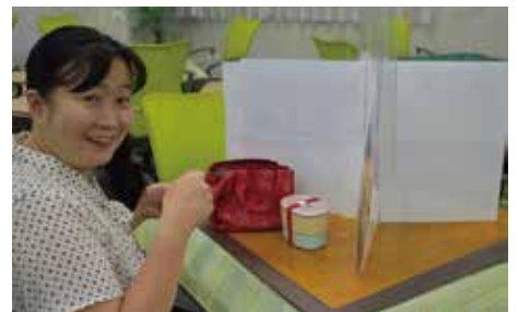
食事中のパーティション