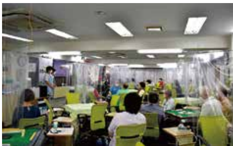
飛沫防止シートを設置