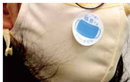
喘息バッジの工夫