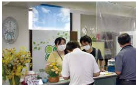
スタッフ含め全員マスク着用