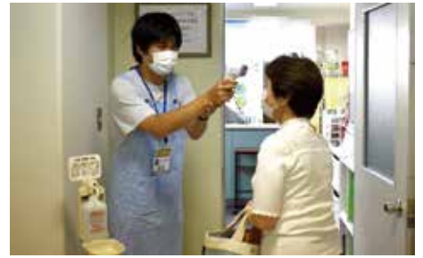
来場時検温と手指消毒