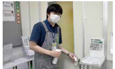
共有部分の消毒の徹底